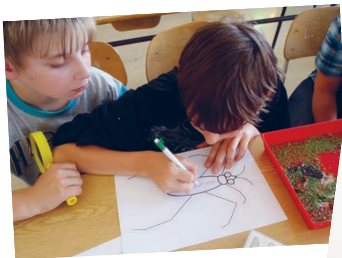
ZŠ Ledec nad Sázavou

Před dnešní hodinou jsem nevěděl, že obyčejné bruslačky jsou vlastně hodně zajímavými živočichy.