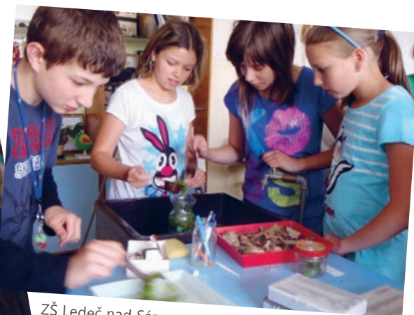
ZŠ Ledeč nad Sázavou

Žáci pracují ve 2–3členných výzkumných týmech. Nejprve si do pracovních listů sepíší, co všechno chtějí ve skupině zjistit, aby věděli, na co zaměřit svou pozornost. Žáci musí mít stále na paměti své výzkumné otázky. Po zapsání dejte žákům k dispozici veškeré pomůcky pro tuto aktivitu. Motivujte je, ať zkusí bruslačkám udělat prostředí podobné přirozenému, aby je v něm mohli pozorovat. Mohou se pokusit nabídnout živočichům i potravu. Poradte jim, ať do nádoby napustí vodu jen do poloviny a na vodní hladinu položí suché listy či kůru. Doporučte žákům, aby nedávali na hladinu moc suchého listí, okřehku apod. materiálu, protože by mohli mylně usoudit, že bruslačky se nepohybují po hladině, ale po objektech na ní ležících. Do takto připravené nádrže mohou žáci vpustit bruslačky. Nabádejte je k ohleduplnému chování a manipulaci s živočichy. Potom žáci pozorují pohyb bruslařek po vodní hladině a snaží se zjistit, jakými částmi svých těl se bruslačky vody dotýkají. Dále žáci vhodí do nádoby bruslačkám potravu (např. octomilku, drobnou mušku, komára apod.). Pozorují, jak bruslačky loví svou kořist. Průběžně si píší poznámky do pracovního listu. Na závěr posbírejte bruslačky zpět do suché lahve s listím. Nádoby na vodu ještě využijeme.