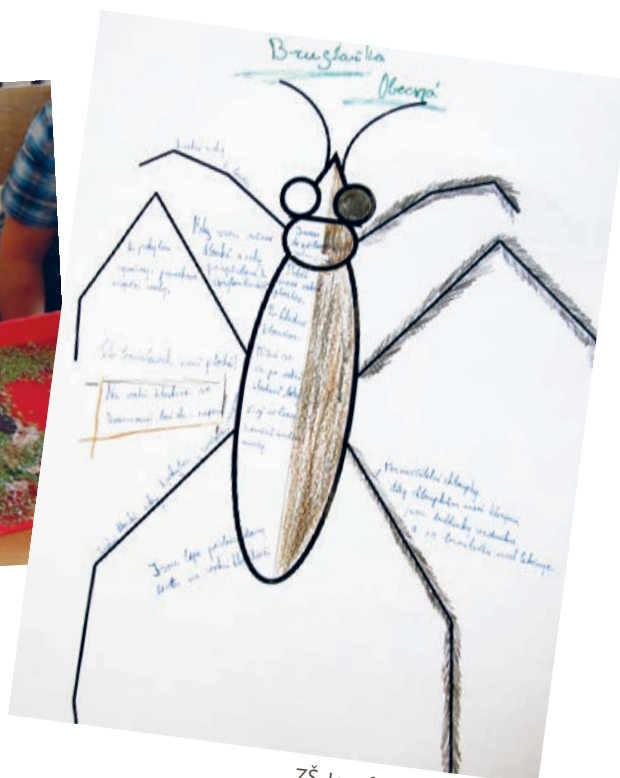
ZŠ Josefa Bublíka, Bánov