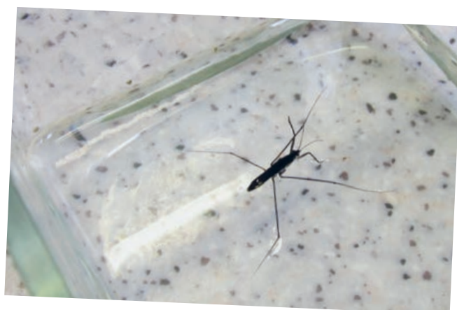
ZŠ Josefa Bublíka, Bánov